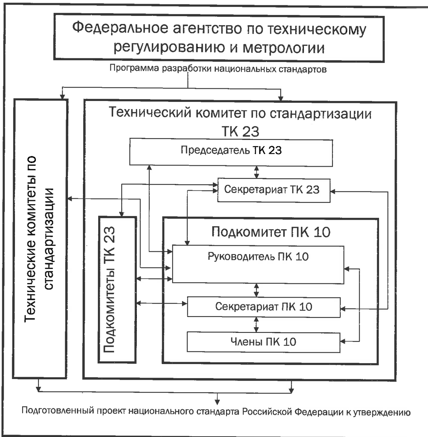
Схема взаимодействия ПК 10 при разработке национальных стандартов Российской Федерации